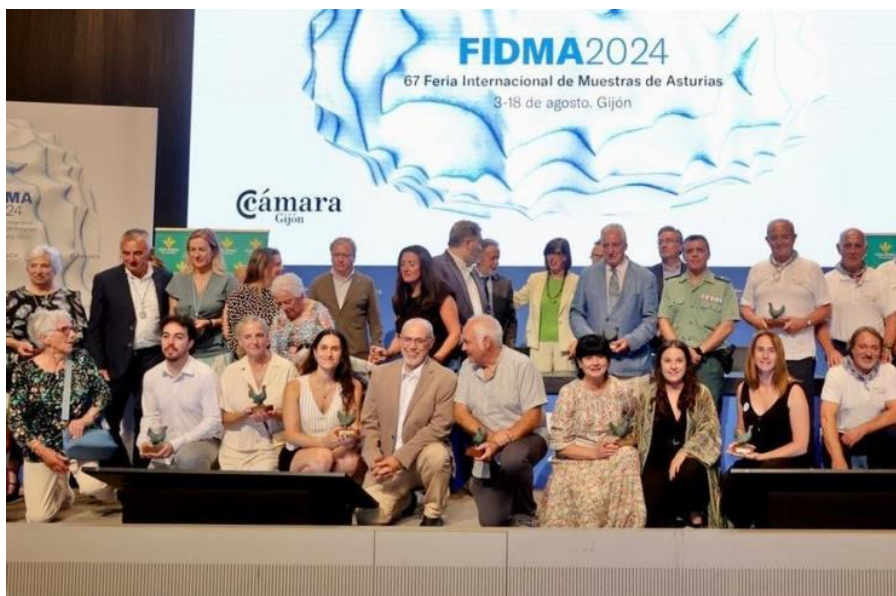
Entrega de los Urogallos en la FIDMA de Gijón