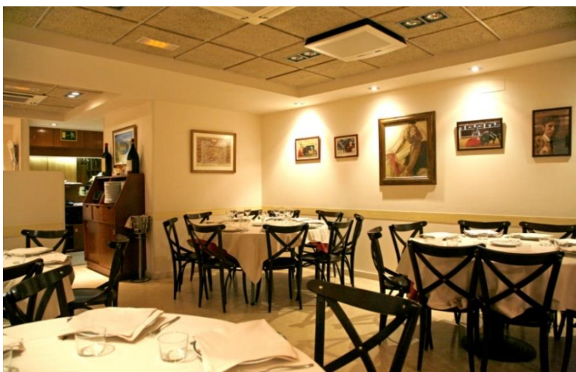
Casa Hortensia – Restaurante ESPECIALIZADO EN COMIDA ASTURIANA C/ Farmacia, 2 Plantas 2ª y 3ª (28004 Madrid) Telfs : +34 915 390 090 – 91 522 42 18 – 91 531 37 24 E-mail: restaurante@casahortensia.com http://www.casahortensia.com