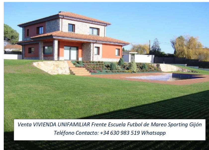
Venta VIVIENDA UNIFAMILIAR Frente Escuela Futbol de Mareo Sporting Gijón Teléfono Contacto: +34 630 983 519 Whatsapp